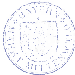
Enrico Corongiu 1. Bürgermeister